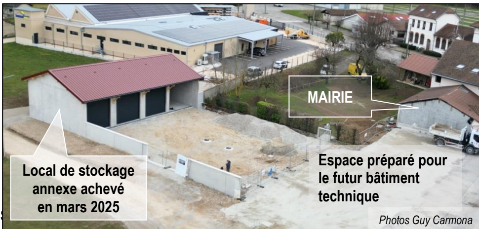
Local de stockage annexe achevé en mars 2025

Un grand merci aux pompiers et soignants bien sûr, mais aussi aux collectivités, associations et simples particuliers qui nous ont témoigné leur soutien. Un sacré coup de chapeau à tous nos personnels, les techniciens logés depuis 5 mois dans des conditions précaires, au service administratif qui a redoublé d'efforts pour constituer les dossiers des assurances, à nos collègues élus, qui eux non plus n'ont pas ménagé leur peine. Un vrai travail d'équipe 👍