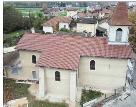
2 e tranche de la rénovation de l'église, la façade a été entièrement refaite avec un enduit à la chaux. Coût de cette tranche 100 000 €.

+ 4 000 € . Résultat à confirmer pour l'année qui vient !